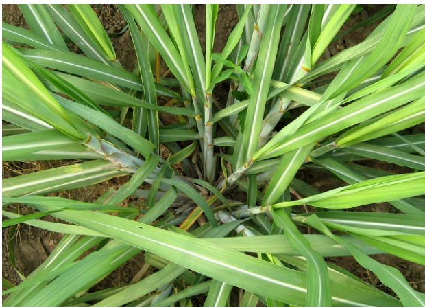
Mọc mầm khỏe