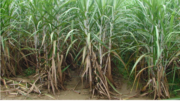
Giống LK92-11, 6 tháng sau trồng tại vườn thí nghiệm NASU