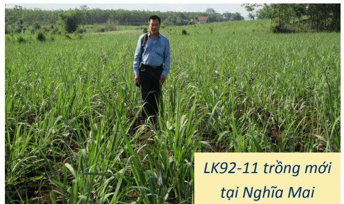
LK92-11 trồng mới tại Nghĩa Mai