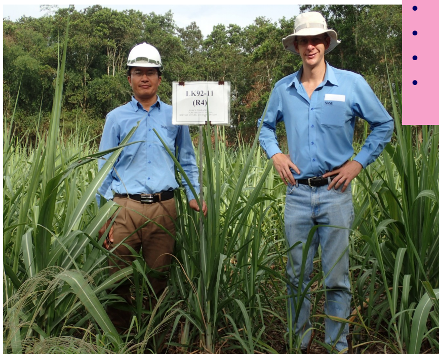
Mía LK92-11 lưu gốc năm thứ 5 tại vườn thí nghiệm NASU