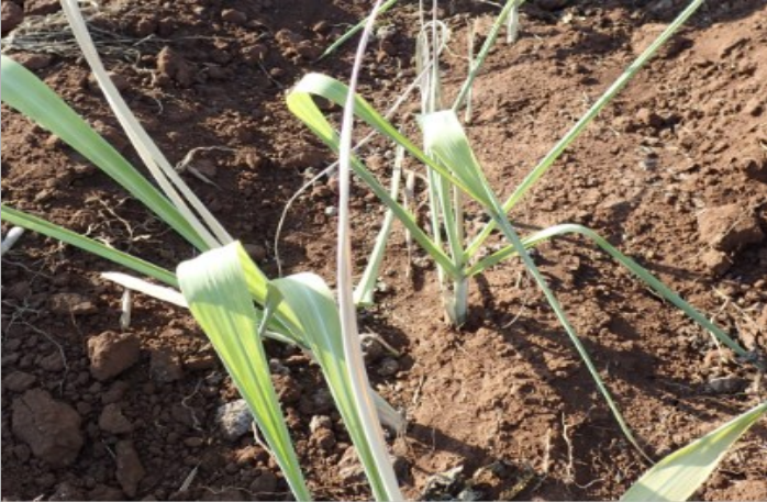
Ruộng mía bị sâu đục thân 5 vạch đầu nâu gây hại