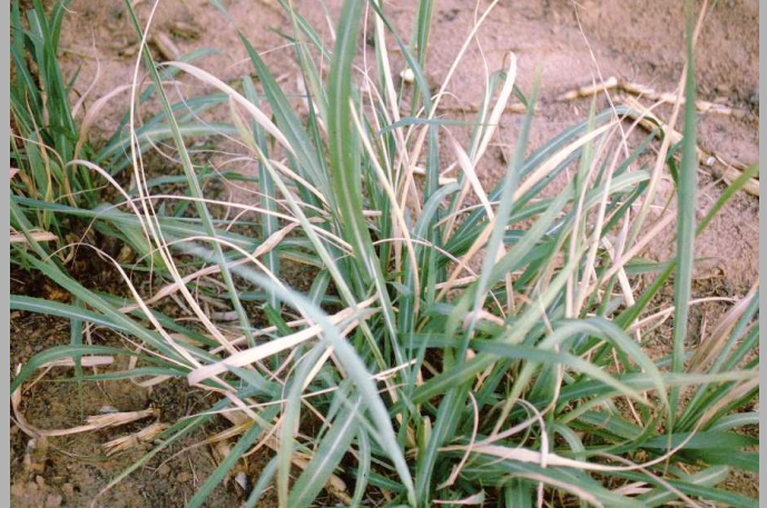
Sâu đục thân 5 vạch đầu nâu gây hại trên mầm mía